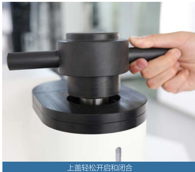
上盖轻松开启和闭合

人的简洁大方颜值，由设计大师亲自操刀，可定制女性粉色，给严肃的实验室增加一丝温润。