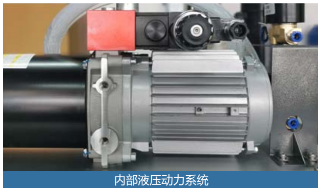
内部液压动力系统

强力加热、澎湃加压、急速冷却。身兼三项绝技的镶嵌设备，能把镶嵌工序的时长压缩在难以置信的 6 分钟以内。